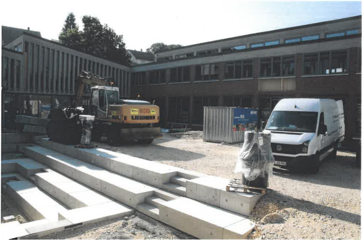
Außenanlagen bei Riegel 2