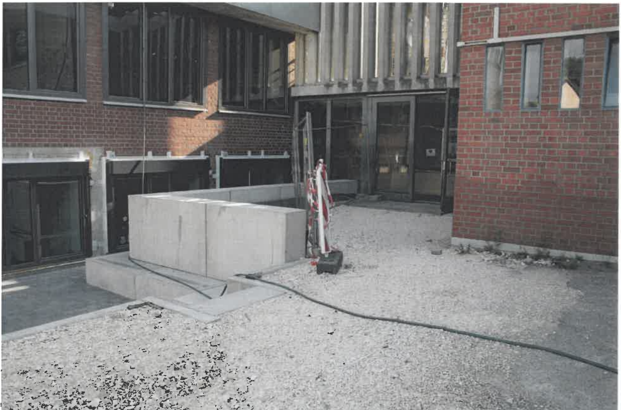
Außenanlagen bei Riegel 1