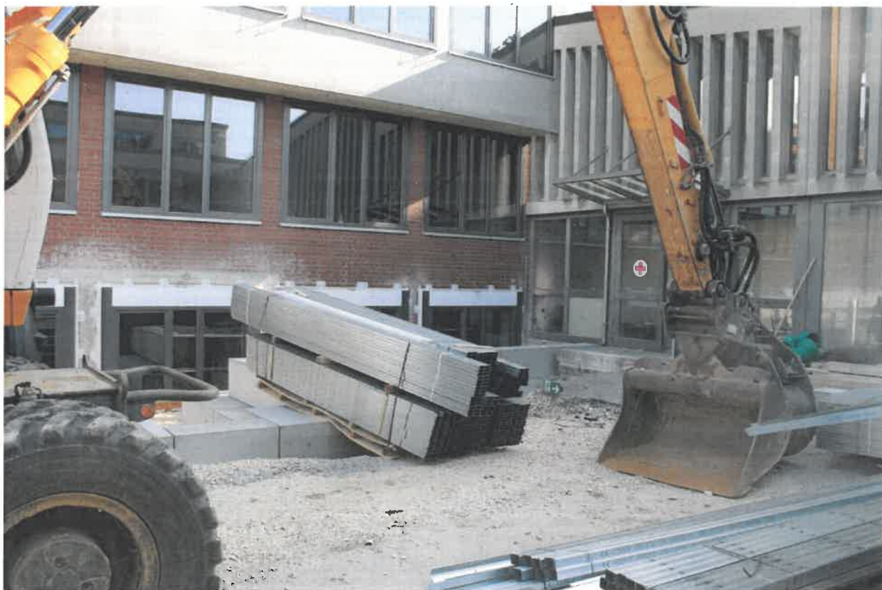
Außenanlagen bei Riegel 2