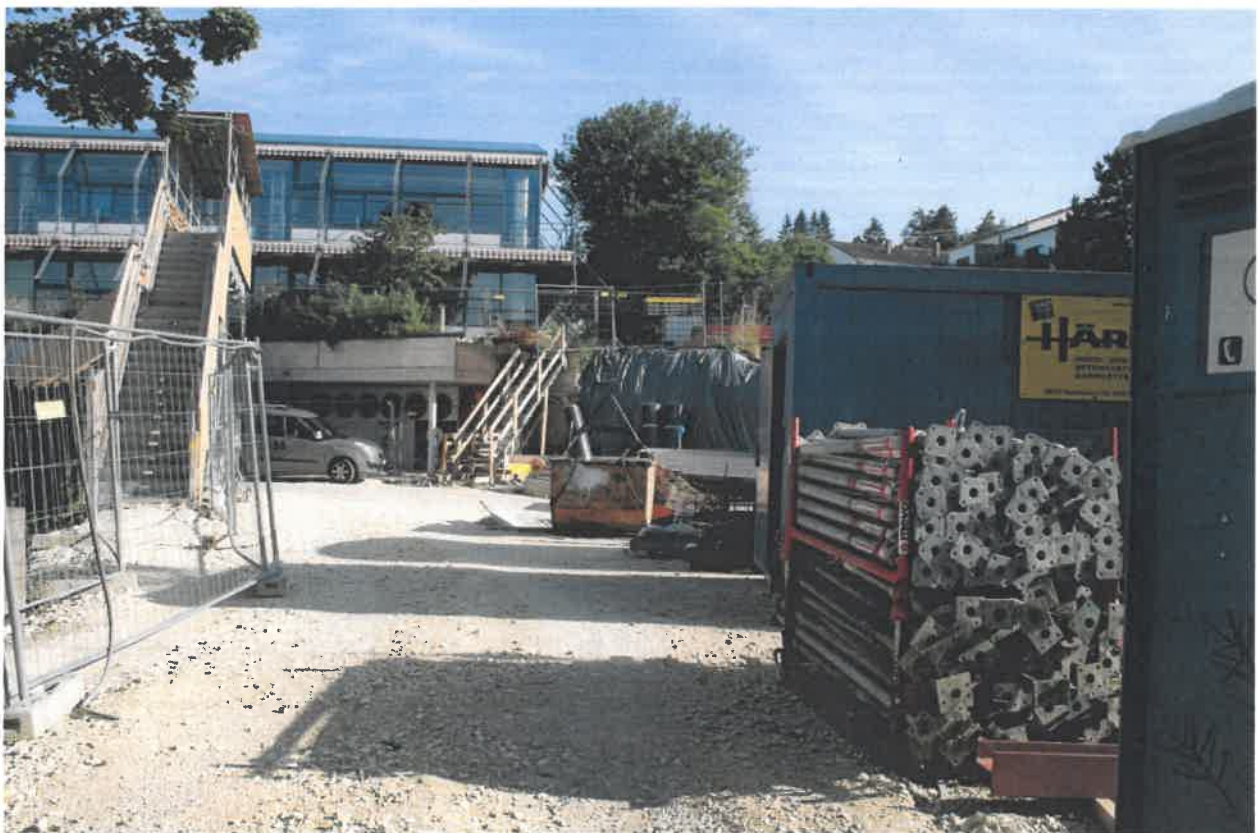
Außenanlagen im Bereich Mensa und Verwaltung