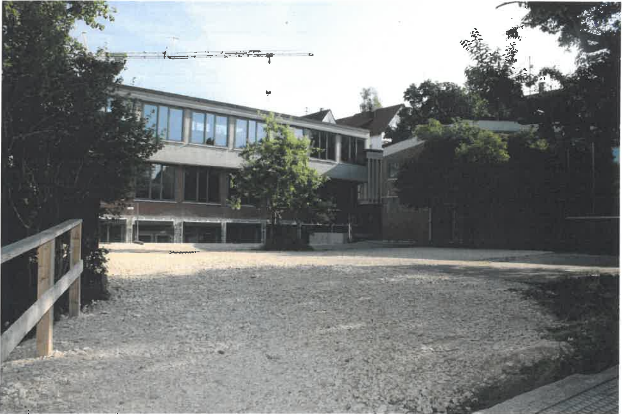
Außenanlagen bei Riegel 1