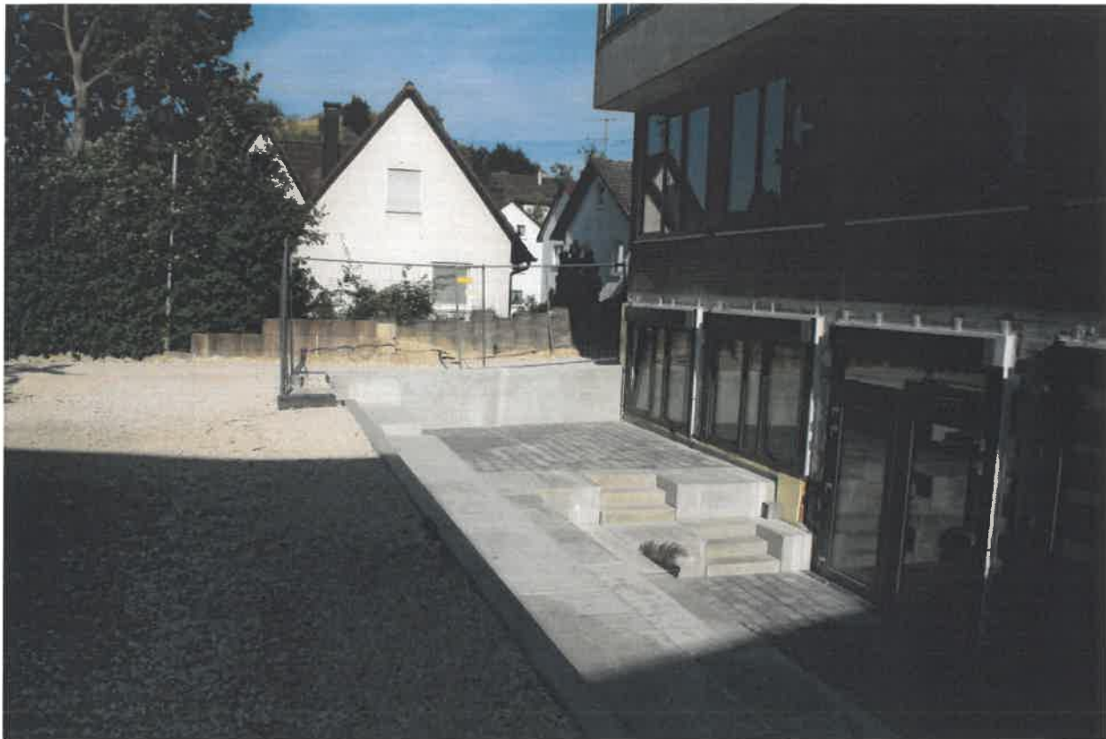
Außenanlagen bei Riegel 1