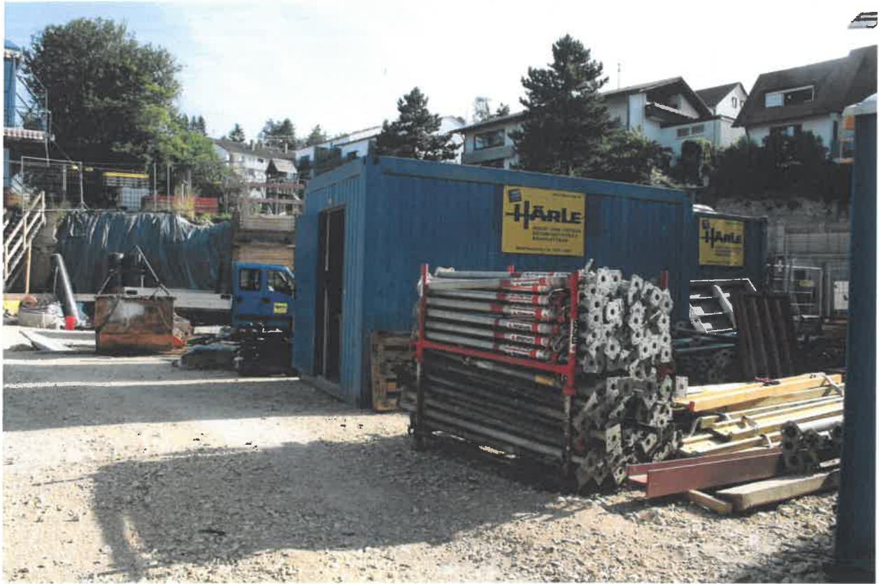
Außenanlagen im Bereich Mensa und Verwaltung